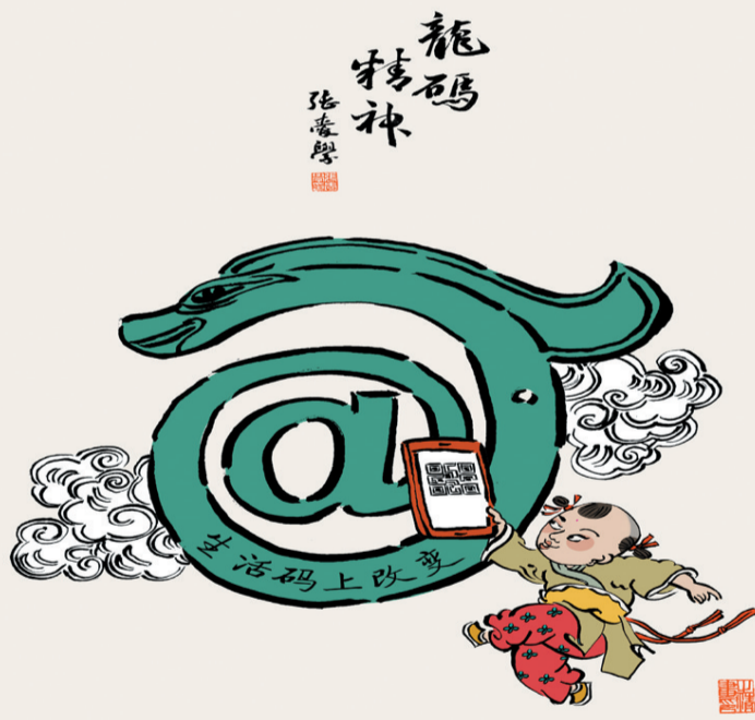
龙“码”精神 作者 张爱学