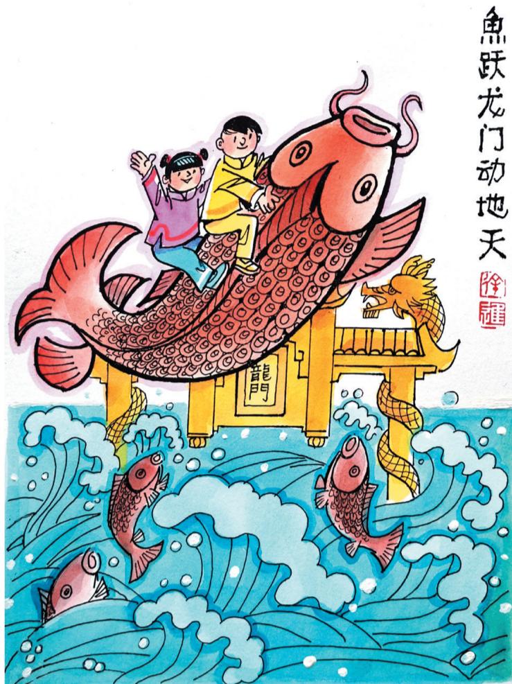
鱼跃龙门动地天 作者 徐进