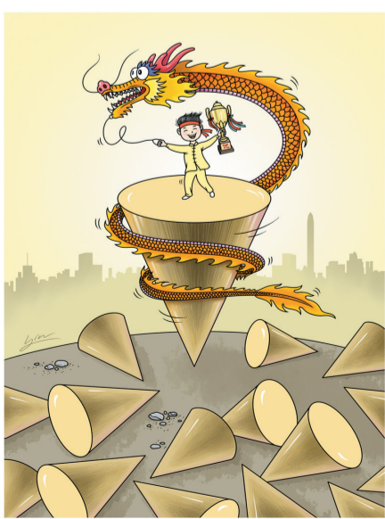
自策 作者 尹元钧