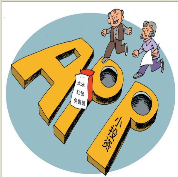
免费领 作者 毕传国