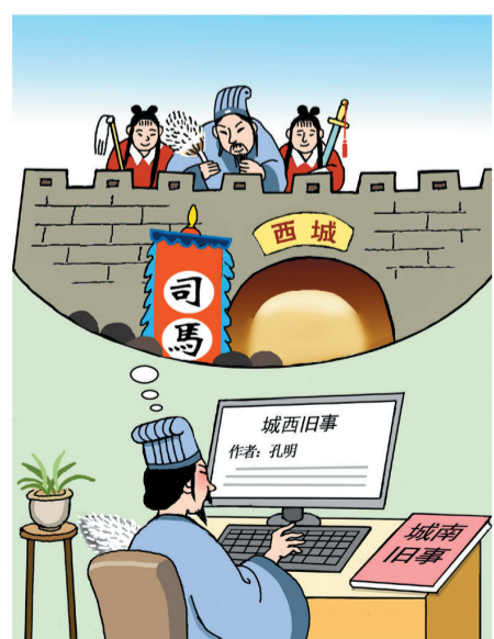
我也写一篇 作者 邸天行