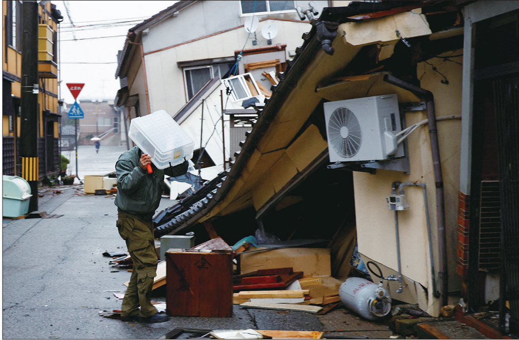
1月6日,在日本石川县轮岛,一名男子用塑料盒挡雨走在路上。

一名在一家肉铺门口接水的老人告诉记者,以前经常来这家肉店,知道他家门口有水龙头,于是来这里讨水。肉铺老板一边帮老人接水一边说,这个是地下水,只能冲洗厕所之类的,