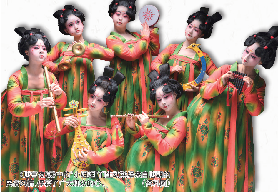
《唐宫夜宴》中的“小姐姐”们生动演绎来自唐朝的民俗风情,俘获了广大观众的心。 (资料图)