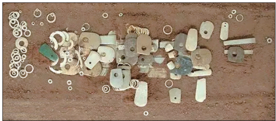
视频截图：考古学家推演“复原”的安徽含山凌家滩遗址“07M23号墓”随葬玉器初始摆放位置场景。

《何以中国》希望拍出“与博物馆截然不同的感受”。230多个拍摄点，分布于全国20个省份，即使是考古工作者也几乎无法逐一抵达。