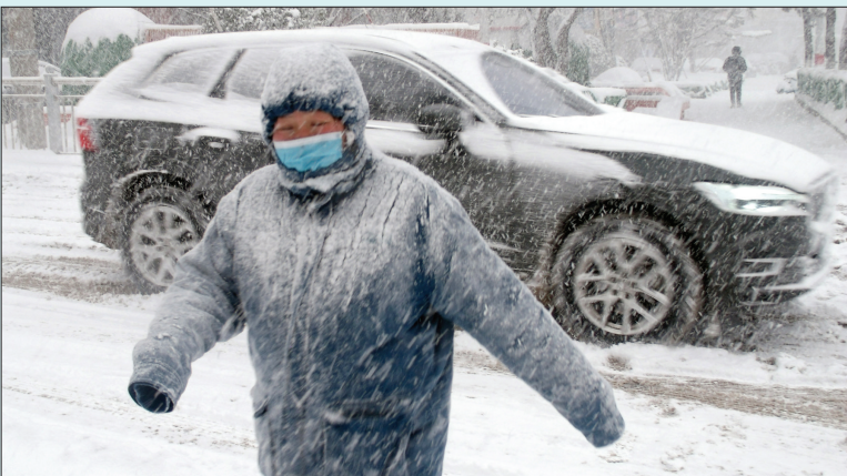
风雪归人 芝罘中学九年级十班 谭铮 摄