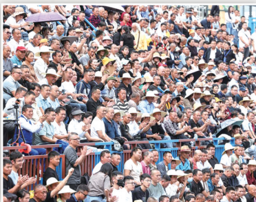
今年10月25日,全国和美乡村篮球大赛(村BA)总决赛在贵州省台江县台盘村开赛,观众在看台上观看比赛。