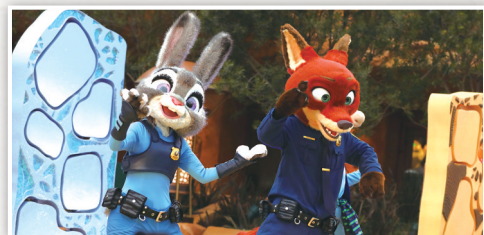
在上海迪士尼乐园“疯狂动物城”,“狐狸尼克”和“兔子警官朱迪”亮相。