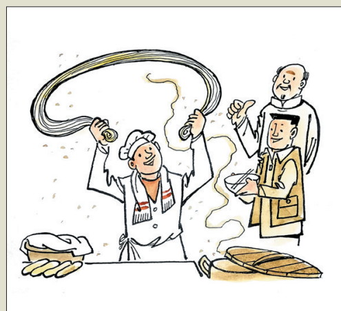
手抻龙须面，技艺是家传