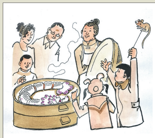
周日蒸龙肉，阖家喜冲冲