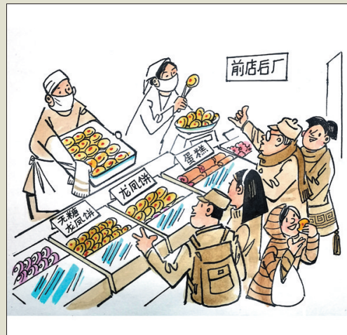
选购龙凤饼，厅堂好喜庆