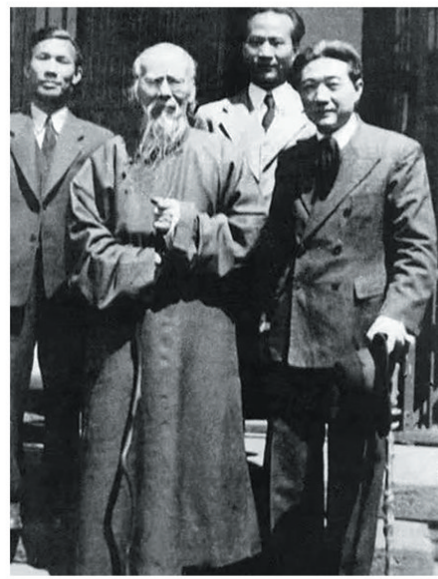
齐白石和徐悲鸿等人合影