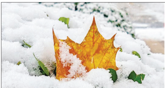
芝罘区南通路小学 五年级六班 褚瑞锡