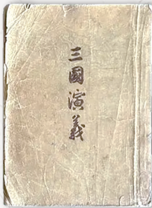
1953年版《三国演义》

著名演员鲍国安回忆,当年拍摄《三国演义》电视剧,王扶林导演定下的原则就是忠于原著。现场虽然不是同期录音,但是演员台词不能和原著差一个字。在谈及如何演绎“曹操”这