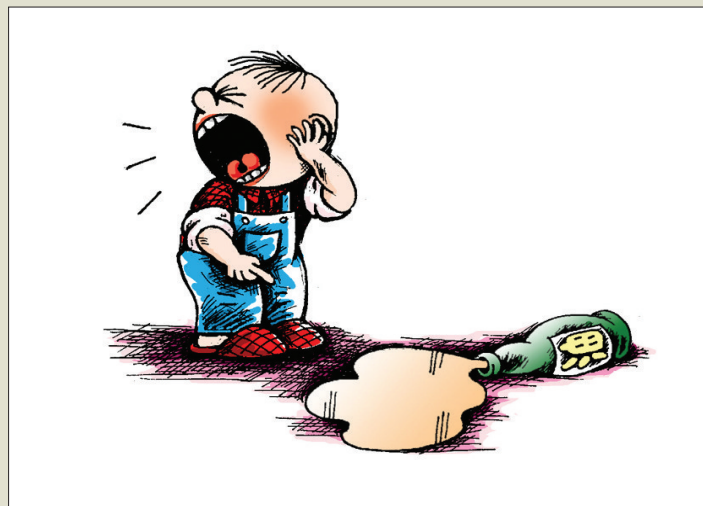
妈妈，油瓶倒了管不管呀？