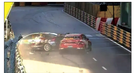
两辆赛车相撞现场

据媒体报道,11月19日,在参加“澳门房车杯-CTCC中国汽车场地职业联赛”时,58岁的郭富城驾驶的88号赛车在比赛中失控,与另一辆赛车相撞,最终双方都无奈退赛。