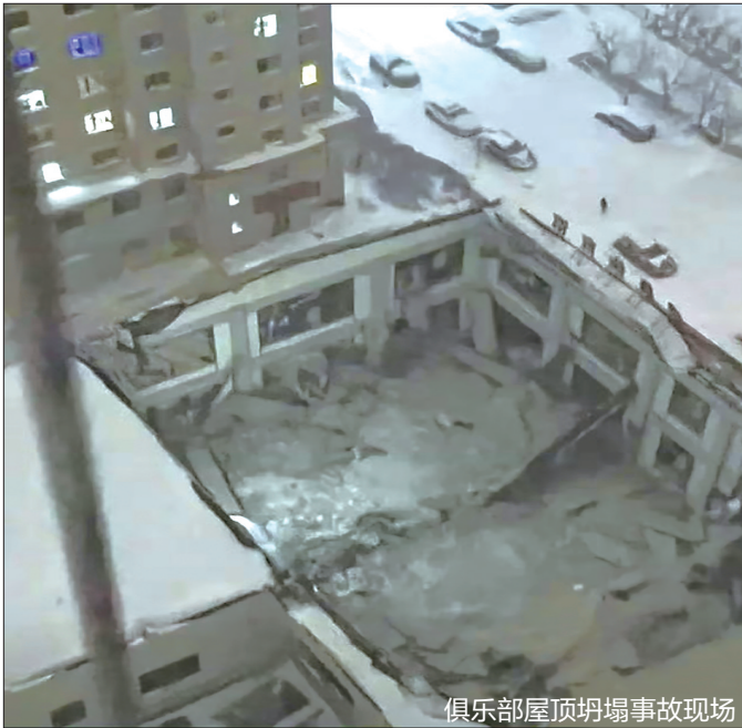
俱乐部屋顶坍塌事故现场

有限责任公司,监理单位为佳木斯三江建设监理公司,2020年7月通过验收。 悦城广场综合体7号楼建筑面积3208.96平方米,高度为9.05米,基础形式为独立基础,结构形式为框架结构,其中东部为二层建筑(面积2533.96平方米),屋顶结构形式为混凝土结构,西部为单层建筑(坍塌部分,面积675平方米),屋顶结构形式为H型变截面钢梁结构。该建筑所有权人于2020年5月至2022年12月间,将场所租赁给他人经营。2022年12月起,由桦南县新阳光健身俱乐部管理,主要用于开展篮球、乒乓球、羽毛球等活动,面向社会经营。 据了解,6日19时30分许,消防救援力量到场,第一时间展开搜救行动。通过调取视频监控研判被困者位置,并利用生命探测仪配合搜救犬对埋压人员进行精准定位。经专家分析研判后,采取顶撑加固保护、机械吊升转移等措施,争分夺秒营救被困人员。7日0时35分,坍塌事故