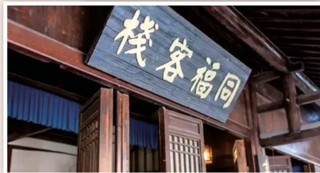
横店影视城内悬挂“同福客栈”牌匾的建筑。

剧方认为,景区攀附、借用电视剧《武林外传》的影响力及影音、图片等素材,进行线上线下关联性宣传,吸引了大批游客前往,并使游客误以为景区与《武林外传》达成了授权合作。现剧方已聘请律师收集相关证据,并向横店影视城及其背后的主体公司发送律师函,郑重要求对方立即停止使用电视剧《武林外传》的故事场景、人物名称、人物关系等元素,拆除全部“七侠镇影视主题街”相关实景搭建建筑,删除全部相关宣传内容,并公开赔礼道歉,赔偿经济损失。目前,横店影视城方面未作出任何回应。