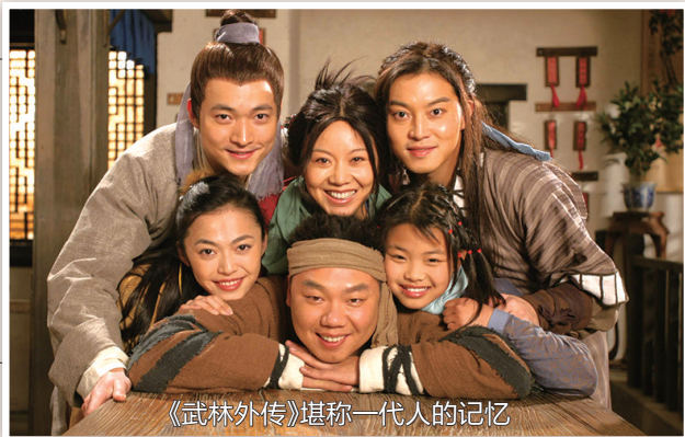
《武林外传》堪称一代人的记忆

11月5日下午,电视剧《武林外传》官方微博发布长文,斥责浙江横店影视城侵犯了《武林外传》著作权,原因是横店影视城以《武林外传》为原型,建了同福客栈、李大嘴食铺等场景并组织了主题活动。《武林外传》方面认为,景区和相关主题活动未曾获得授权。