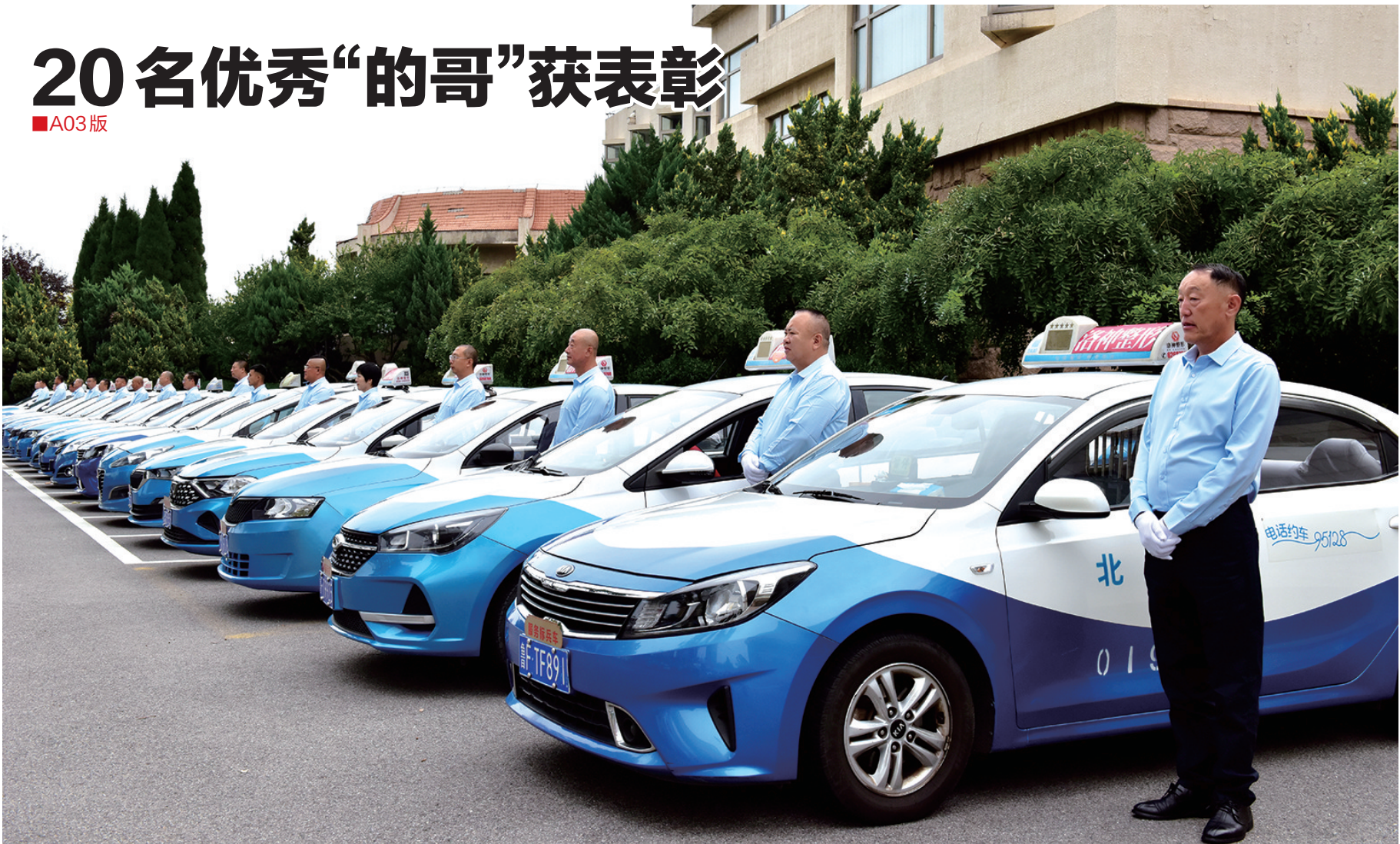
昨日,我市举行交通枢纽出租汽车服务标兵表彰大会,20名优秀“的哥”获表彰。