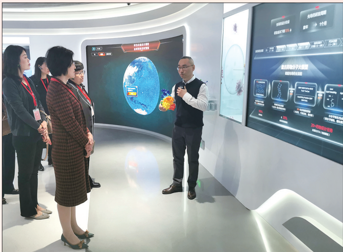
市妇联带领部分女企业家组织及巾帼企业负责人赴深圳市开展考察学习和招商推介活动。

时间,是标注进步步伐的刻度。5年来,全市各级妇联组织以深化改革为动力,以实现广大妇女对美好生活的向往为奋斗目标,牢记使命、忠诚履职,积极发挥桥梁纽带作用,广大妇女的获得感成色更足、幸福感更可持续、安全感更有保障。