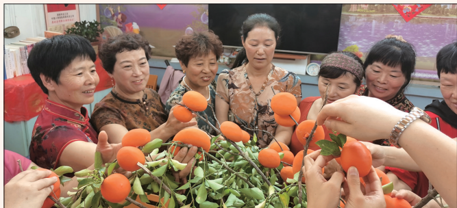
旗源旗袍博物馆服务队开展生活美学进家庭、“柿柿如意”手工制作等主题活动。

冲刺万亿之城,离不开人才支撑。以“家人之名”弹好招才、引才、留才“三部曲”,成为市妇联“联”动群团和社会资源服务中心大局的重要切入点和突破口。如今,由市县两级妇联组织牵头举办的各类联谊活动“遍地开花”。一年半时间、165场活动、1.2万人参加、初次牵手成功率达16%，“爱在山东·遇见幸福”已成为青年人才喜欢、父母家长信赖、党委政府放心的响亮品牌。