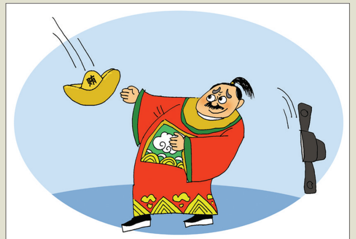
有得有失 作者 畢傳國