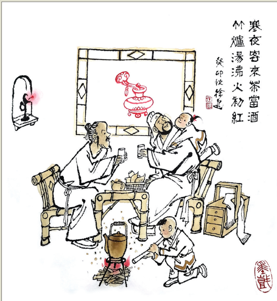
寒夜客來茶當酒 竹爐湯沸火初紅 作者 徐進