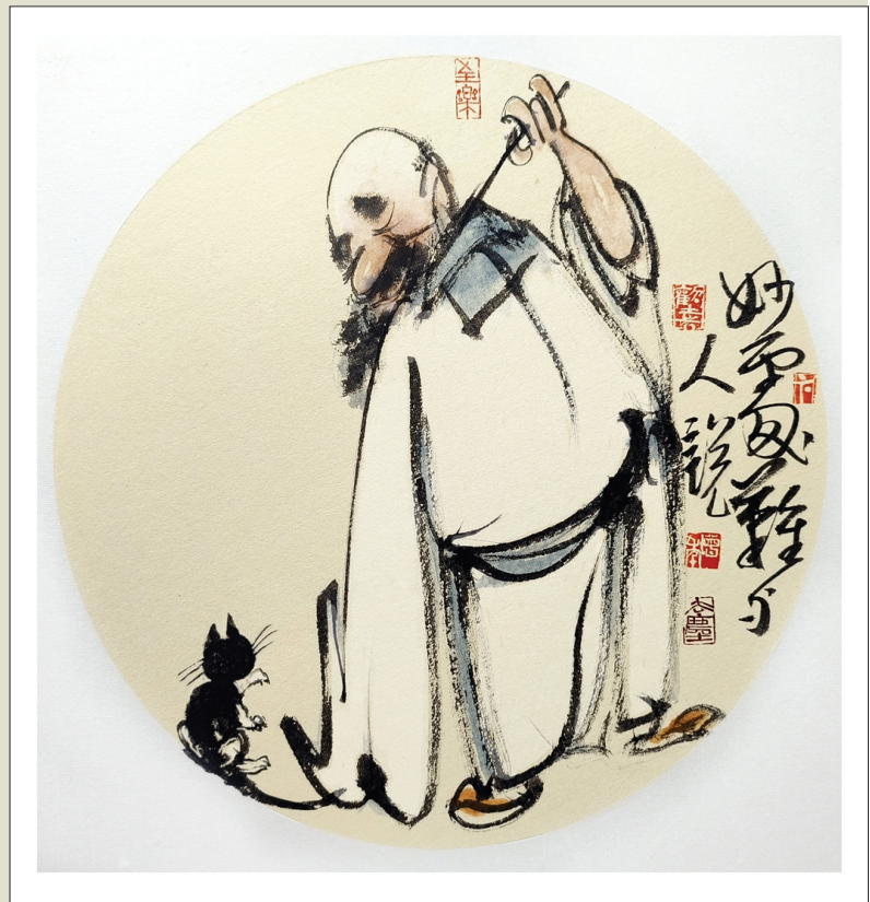
妙處難與人說 作者 卞增年