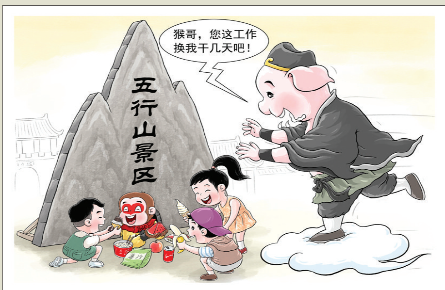
幸福職業 作者 郝延鵬