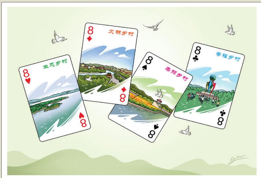
一手好牌 作者 尹元鈞