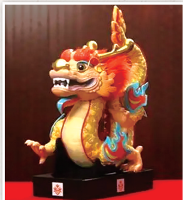
2024年“欢乐春节”吉祥物——“吉祥龙”。

2004年和2005年，凡尔赛宫和故宫先后合作举办“康熙大帝展”和“‘太阳王’路易十四——法国凡尔赛宫珍品特展”，聚焦处于同一时期的两位君王。2014年，凡尔赛宫举办了一场名为“中国在凡尔赛——18世纪的艺术与外交”的展览，展现法国贵族和官僚