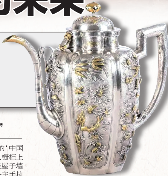
凡尔赛宫馆藏的“花鸟纹雕银部分镀金水壶”。

军介绍，中国艺术对西方艺术特别是法国洛可可艺术产生了重要影响。中国艺术品给法国人带来全新的感官体验。许多贵族的庄园、城堡里都建有“中国屋”，大家竞相追捧，模仿来自中国的舶来品。这一交流高潮也伴随着部分有识之士对中华文明更为全面的探索与了解，其中精华如中国哲学在一定程度上影响了法国的启蒙运动。