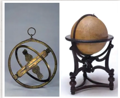
故宫博物院馆藏的部分法国产及清宫造办处仿制的西方科学仪器。