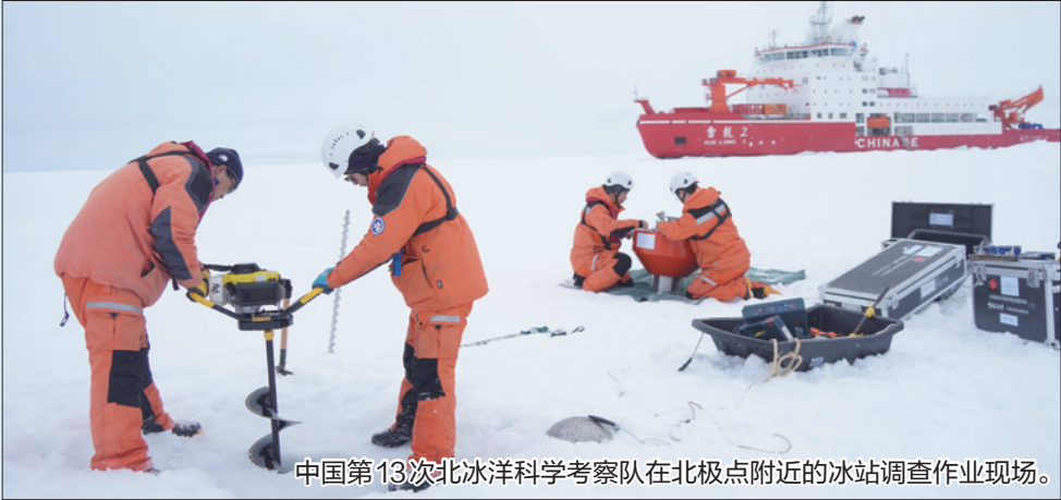
中国第13次北冰洋科学考察队在北极点附近的冰站调查作业现场。