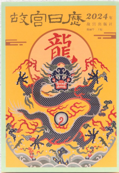
《故宫日历·2024年》

2024年,甲辰年,生肖龙,《故宫日历·2024年》封面图案选用清代黄地九龙牡丹纹漳绒毯局部,腾飞于海水江崖之上的祥龙,充满活力。