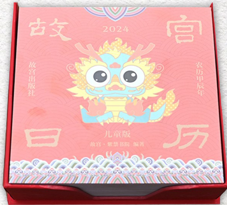
《故宫日历·2024年·儿童版》