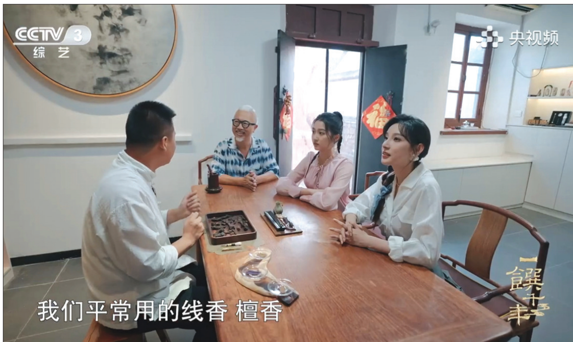
我们平常用的线香 檀香

芝罘的魅力，在于一砖一瓦、一街一巷。趁着周末来所城里闲庭信步，尝一尝风味美食，打卡宝藏店铺，逛一逛非遗展馆，享受片刻的休闲和静谧吧。