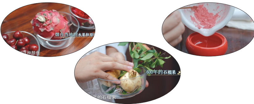
烟台当地的水果和原