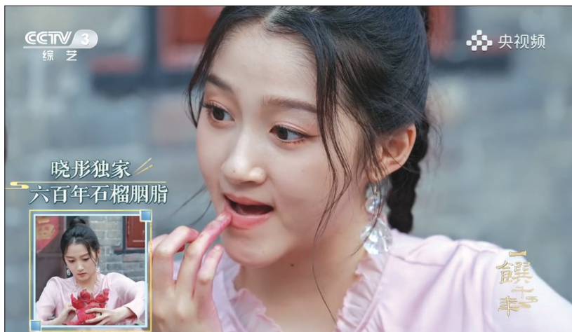
晓彤独家 六百年石榴胭脂