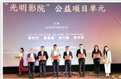
第十八届中国长春电影节“光明影院”公益项目单元中的无障碍影视作品捐赠仪式。

眼下正值第十八届中国长春电影节,在“光明影院”放映单元,约百余名视障人士共同欣赏了无障碍电影《狙击手》。