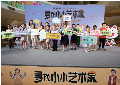
获奖小朋友们“为招行代言”

每个孩子都是天生的艺术家,由招商银行烟台分行主办的金葵花“小小艺术家”“小小银行家”暑期系列活动落下帷幕,27日在烟台大悦城举行颁奖典礼。这个夏天,孩子们在绘画中感受生活之美,在暑期实践中培养财务管理认知。 在当今经济社会快速发展的背景下,培养孩子的全面素质至关重要,金钱