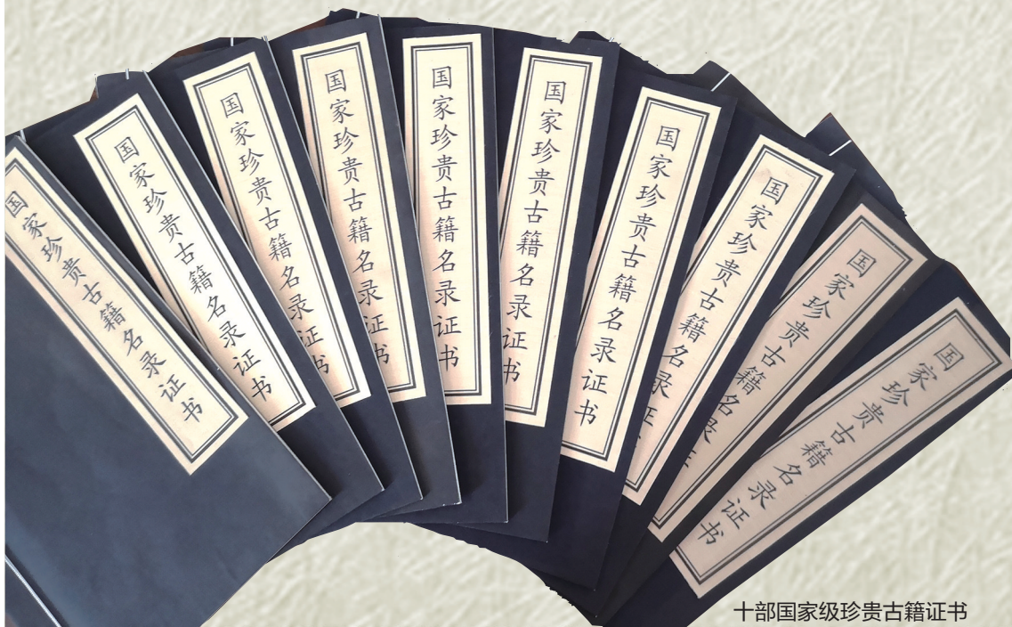
十部国家级珍贵古籍证书

慕湘藏书馆藏此书纸墨精洁,版式疏朗,字划棱峭,品相绝佳,具有很高的艺术价值和研究价值。