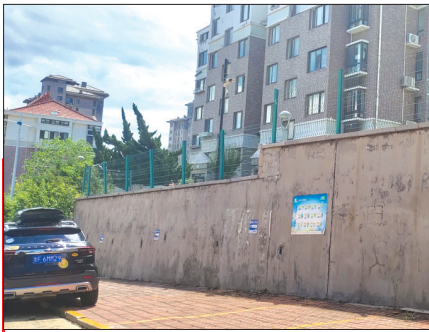
划在人行道上的车位

本报讯(YMG全媒体记者 何晓波 摄影报道)日前,“烟台民意通”热线6601234接到市民反映,称芝罘区阳光上城小区、上尧花园和鲁东大学南区之间的祥尧街作为一条街道,不知何故被人安装上了收费栏杆,一路向西的陡坡路边的人行道被划成了私家车停车位。