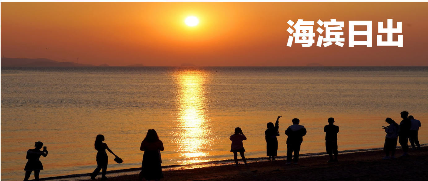
清晨的莱山海滨，红日冉冉升起，早已等候多时的人们举起相机和手机，留下这壮丽的一瞬。

经过项目征集、双向选择、沟通对接，共有来自清华大学材料学院、化工系、航发院、软件学院、核研院、国际研究生院、电机系的15名博士，到万华化学、泰和新材、冰轮环境、东方威思顿、中科烟台网络研究所开展科研攻关、技术研发等实践活动。实践期间，将围绕烟台市企业在创新驱动和企业发展转型等方面亟待研究和解决的课题需求，开展联合技术研究和科技服务活动。