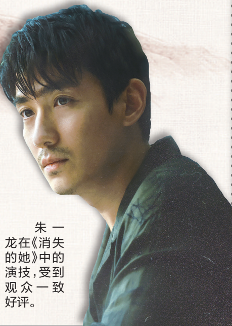
朱一龙在《消失的她》中的演技，受到观众一致好评。

看到文咏珊时的害怕、面部抽搐，得知妻子怀孕时在牢里歇斯底里，各种情绪演绎得精准又饱满。极具突破性的表演，甚至超过了让他拿下金鸡奖的《人生大事》。