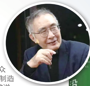
作家陆天明 推出新作《沿途》