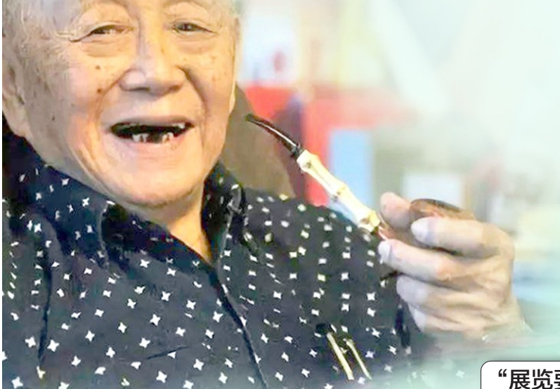
黄永玉先生

作为公众熟知的艺术大师,黄永玉被誉为邮票“猴票之父”,是中国国家画院院士、中央美术学院教授,曾多次在中国美术馆、中国国家博物馆以及海外不少著名场馆举办过个展。他还是一位颇有个性化的艺术大师,年过八旬驾驶跑车飙车、登《时尚先生》杂志封面,给世间留下了潇洒、狂放、不羁的形象。