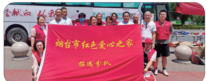
红色爱心之家招远分队宣传无偿献血。

截至昨天下午五点，全市共有496位爱心市民参与无偿献血，其中捐献全血174200毫升、血小板65个治疗量。他们用涓涓热血为城市注入蓬勃正能量，用无私奉献为生命书写健康赞美诗。