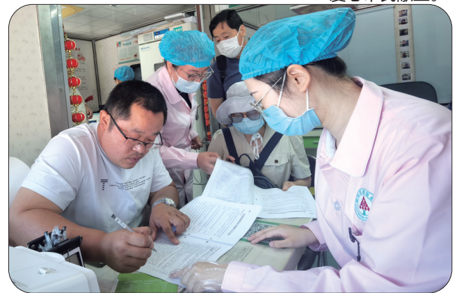
填写无偿献血登记表。

这一天，莱州爱心献血房车、蓬莱爱心献血屋、莱阳采血房车、龙口采血房车和停靠在福山大润发、牟平杨子荣广场、招远府前广场、开发区彩云城等地的采血车，同样迎来了大批无偿献血者。他们用涓涓热血为等待救治的生命送去康复的希望，为烟台这座文明城市注入爱心力量。