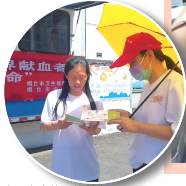
志愿者宣传无偿献血。

今年6月14日是第20个世界献血者日，是无偿献血和支持无偿献血爱心人士的节日。今年世界献血者日的口号是“捐献血液、分享生命”，主题是“汇聚青春正能量、无偿献血传爱心”。这一天，许多经常无偿献血的爱心人士再次撸起袖子捐献大爱，许多新生力量踊跃加入无偿献血队伍。