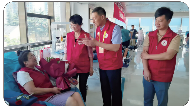
献血市民和志愿者交流。