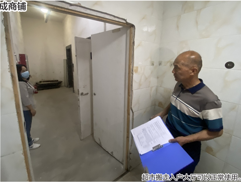
超市搬走入户大厅可以正常使用。

至于入户大厅为何被改为商铺一事,修经理说,自己于5月初才到该小区任职,对之前的情况并不了解。