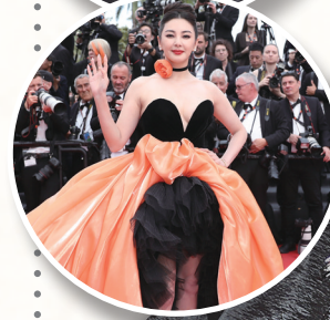
中国群星亮相戛纳

新华社法国戛纳5月16日电 第76届戛纳国际电影节16日晚在法国南部城市戛纳拉开帷幕。