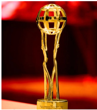
喜旺获格莱德国际食品大奖

本次,由喜旺集团参与修订的《酱卤肉制品质量通则》等六项国家标准的发布,不仅是对喜旺集团在标准修订方面行业地位的认可,更是对喜旺科研实力和高品质的认同。未来,喜旺将继续坚持走标准化、科研化和高品质之路,向世界讲好中国故事,为人类更健康地生活而奋斗!