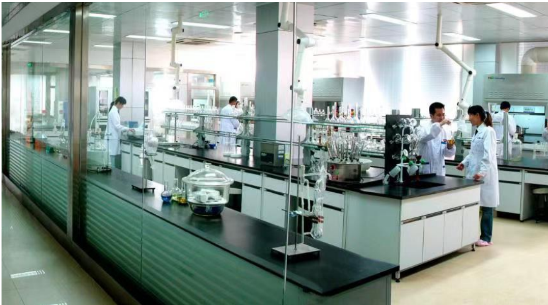
喜旺集团科研中心

位,与中国肉类食品综合研究中心等相关单位联合成立标准起草工作组,完成了标准的修订,修订后的《酱卤肉制品质量通则》,在提升传统食品行业的市场竞争力,规范酱卤肉制品行业发展等方面意义重大。《熏煮火腿质量通则》则对产品分类和标签标识进行规范,让消费者一目了然地了解到产品的质量级别。《中式香肠质量通则》则增加了中式香肠的分类和对肉含量的规定,避免中式香肠以次充好。