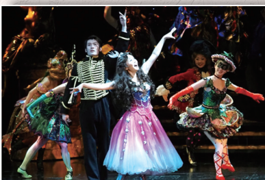
《剧院魅影》推出首个中文版

《剧院魅影》中文版演出由40余名中国音乐剧、歌剧、舞蹈演员共同呈现,乐池内配有16人组成的管弦及键盘乐队现场伴奏,形成强大而丰富的声场。在服饰和化妆方面,配有230