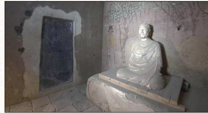
莫高窟藏经洞(资料照片)