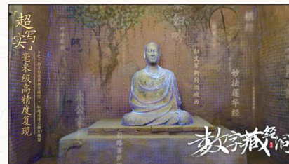
“数字藏经洞”效果图