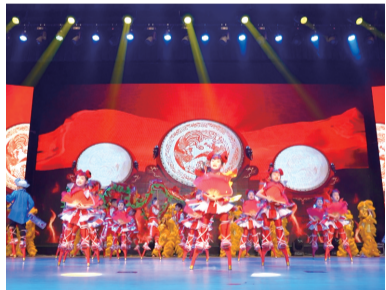
少儿民俗表演《我和爷爷踩高跷》。

本届市民文化节将一直持续至明年3月，市民合唱大赛、市民舞蹈大赛、首届喜剧人大赛、文化创意设计大赛、才艺展示大赛、2023“四季村晚”系列活动、“网格+文化”社区惠民项目、“对话烟台”烟台文旅大讲堂等特色活动也将陆续开展。