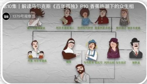
“1379号观察员”为《百年孤独》绘制的人物图谱视频截图

半个多世纪前,38岁的加西亚·马尔克斯写下《百年孤独》第一句话的时候或许很难想到,有一天,这本书会在中国的短视频平台上风靡。为了让更多人读懂这部获得世界文学界高度美誉但“艰涩到难以读完”的小说,一个名为“1379号观察员”的抖音短视频账号发布了动画连续剧,逐帧解构了这本大部头。