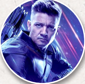
在漫威超级英雄电影中，杰瑞米·雷纳扮演“鹰眼”。

杰瑞米·雷纳在接受采访时，详细说明了自己当时的伤情。他透露当时被救起时，光肋骨就断了14处，脸部、身体右侧多处以及双脚脚踝都有骨折，同时肝脏被肋骨刺穿，右胸塌陷，还有头部大量出血的情形，一度有生命危险。杰瑞米·雷纳坦言如果当时没有他的侄子及救援人员，“那将会是一种可怕的死法”。不过，杰瑞米·雷纳也用正向的态度表示，这次事故让他明白，世界上最重要的事情，就是和家人朋友们在一起，并告诉他们“我爱你”。