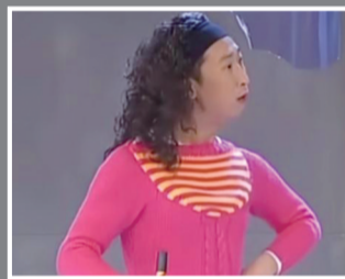
小品《装修》视屏截图