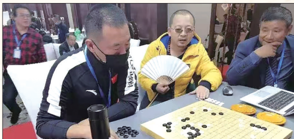
在第一届全国民族智力运动公开赛密芒(围棋)赛中,清华大学围棋基金队对甘肃队。