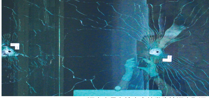
调查人员在枪击事件发生地调查取证。

事发地老国民银行职员。资料显示,斯特金2018年、2019年和2020年夏季在这家银行实习,2022年成为全职员工。据美国有线电视新闻网援引知情人士的话报道,枪案发生前,斯特金被告知将被解雇。