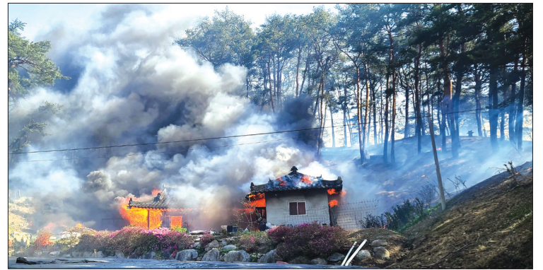
4月11日,韩国江原道江陵市当日发生山火。截至目前,山火造成1人身亡,16人受伤,大面积山林和设施受损。图为山火烧毁一处民居。