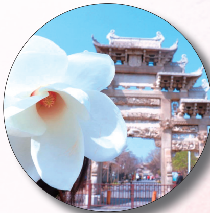
刘晓阳摄于戚继光故里