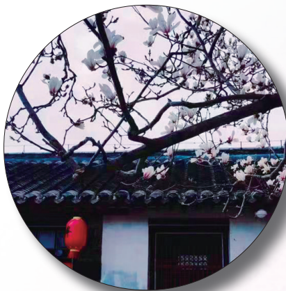
拍客“自然之惠”摄于牟氏庄园