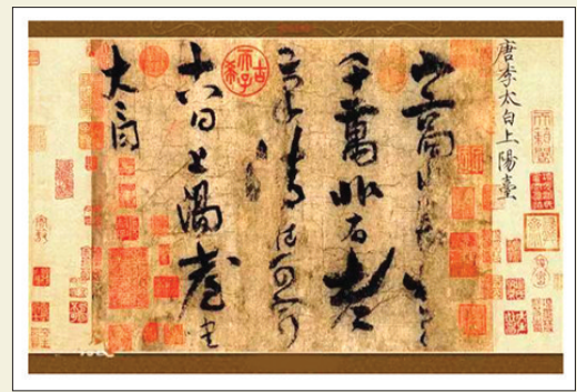
李白存世唯一真迹《上阳台帖》