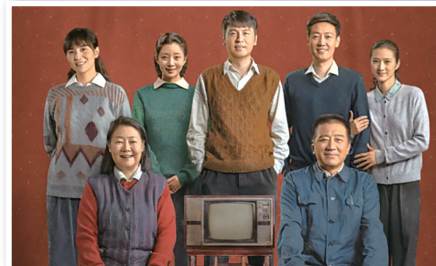
《人世间》入选“大学生赏析推荐作品”

据新华社福州电 3月26日晚，第十一届中国大学生电视节在福州海峡奥体中心落下帷幕，《人世间》等55部作品入选本届电视节“大学生赏析推荐作品”。