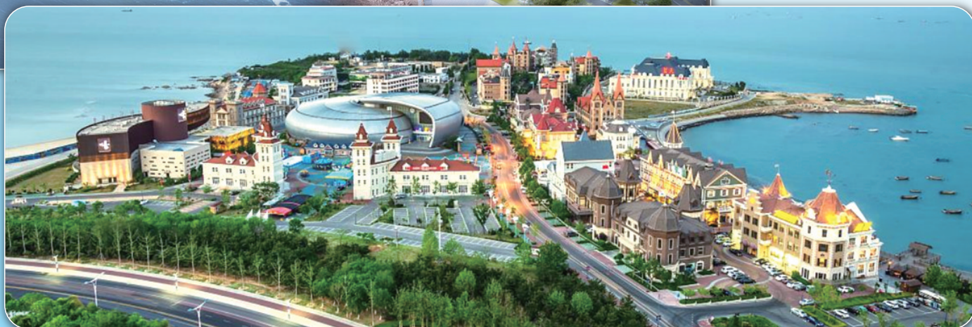
风光旖旎的 渔人码头