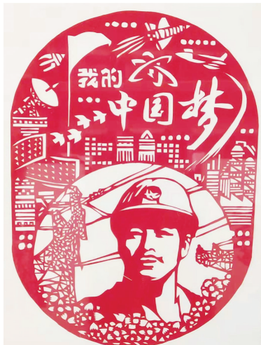
区第一初级中学 教师 林敏