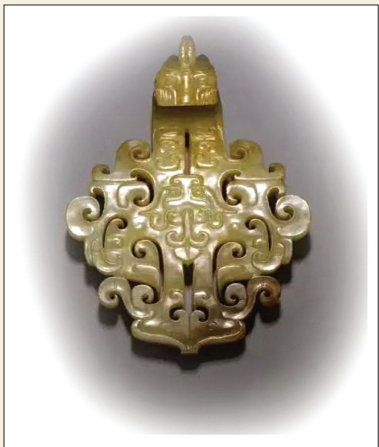
西汉 黄玉带钩 成交价约合人民币:25313863元 尺寸:9.2 x 6.4 x 1.6厘米

前不久,一件西汉黄玉带钩以290多万英镑成交,折合人民币2500多万元人民币,引发一众热议!有人问了,玉带钩是用来做什么的?为何拍出如此天价?