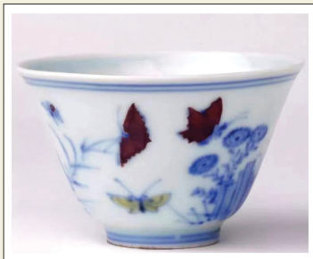
明成化斗彩三秋杯 高3.9cm,口径6.9cm,足径2.6cm

孙瀛洲先生曾编成六句歌诀来辨识此款:大字尖圆头非高,成字撇硬直到腰。化字人匕平微头,制字衣横少越刀。明日窄平年应悟,成字三点头肩腰。