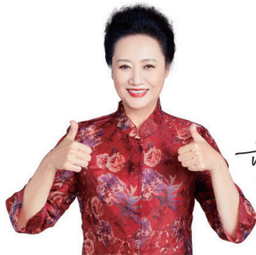
由著名演员王丽云倾情代言的贡宝林木糖醇山药坚果沙琪玛，传承