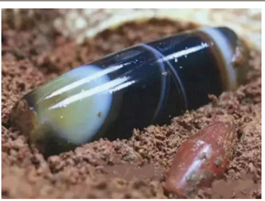
海昏侯墓里出土的玛瑙桶珠

看这些玛瑙珠子的形状和光滑程度,我们不得不赞叹,在两千多年前,我们国家对于玛瑙和玉石的加工工艺已经非常成熟了,无论是切割技术还是抛光技术,都不比现在的高科技工艺差。