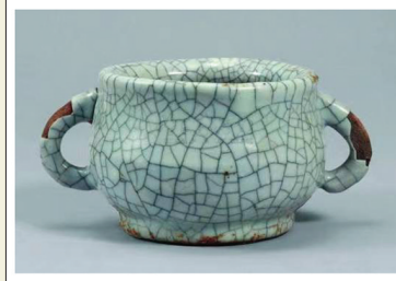
南宋哥窑双耳香炉(出土)