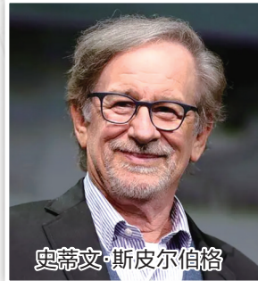
史蒂文·斯皮尔伯格

当地时间2月21日,导演史蒂文·斯皮尔伯格获颁第73届柏林国际电影节终身成就金熊奖,他的新片《造梦之家》也在现场放映。