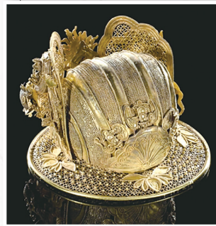
明代双龙戏珠纹冠

新华社香港2月21日电 香港故宫文化博物馆“金彰华彩——香港故宫文化博物馆与梦蝶轩藏古代金器”特别展览于22日向公众开放,共展示220套古代中国金器。