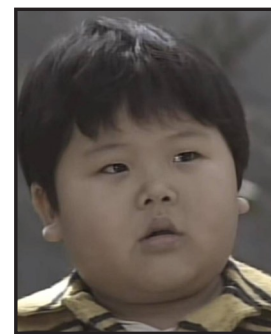
电视剧《小龙人》中贝贝剧照